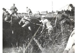
ČECHO-SLOVÁKŮ JÍCÍ NA ŠPIČCE RUSKÉHO FRONTY. V tomto útoku, který se odehrál u Zborova, vstoupili naši vojska v čtyřech hodinách a zajali dvanáct tisíc Austro-Uherů.

Oblíbené písně našich hochů v Česko-Slovenské armádě v Rusku. Favorite Songs of the Čecho-Slovak Army in Russia.